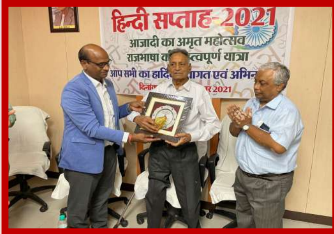
अंचल कार्यालय हरियाणा