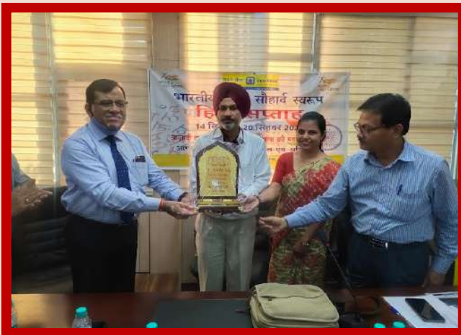
अंचल कार्यालय चंडीगढ़