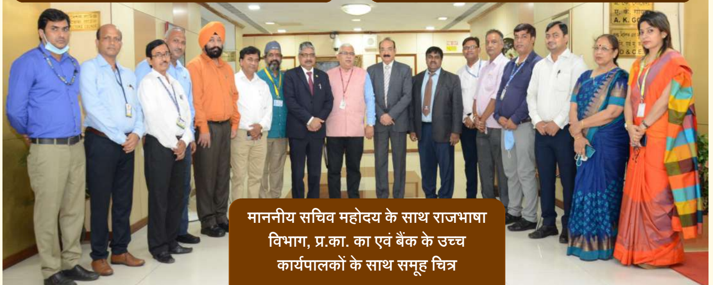
माननीय सचिव महोदय के साथ राजभाषा विभाग, प्र.का. का एवं बैंक के उच्च कार्यपालकों के साथ समूह चित्र