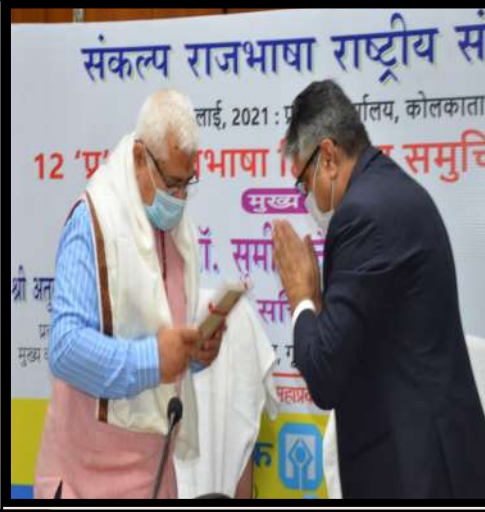
एमडी सर माननीय सचिव महोदय का पुस्तक एवं शॉल से सम्मान करते हुए तथा सचिव महोदय दीप प्रज्ज्वलन करते हुए