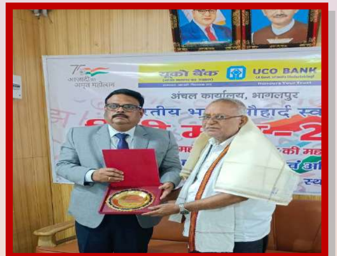
अंचल कार्यालय भागलपुर