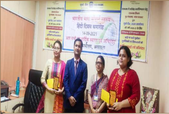
अंचल कार्यालय अगरतला