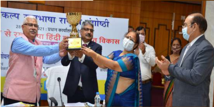
माननीय सचिव महोदय एवं एमडी सर संकल्प राजभाषा चल वैजयंती की ट्रॉफी विजेता अंचल, लखनऊ की मुख्य प्रबंधक(राजभाषा) को सौंपते हुए