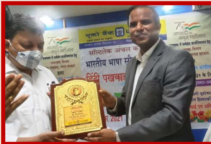
अंचल कार्यालय सॉल्ललेक