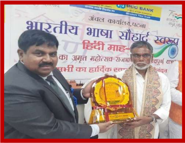
अंचल कार्यालय पटना