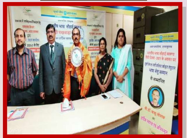
अंचल कार्यालय एर्णाकुलम