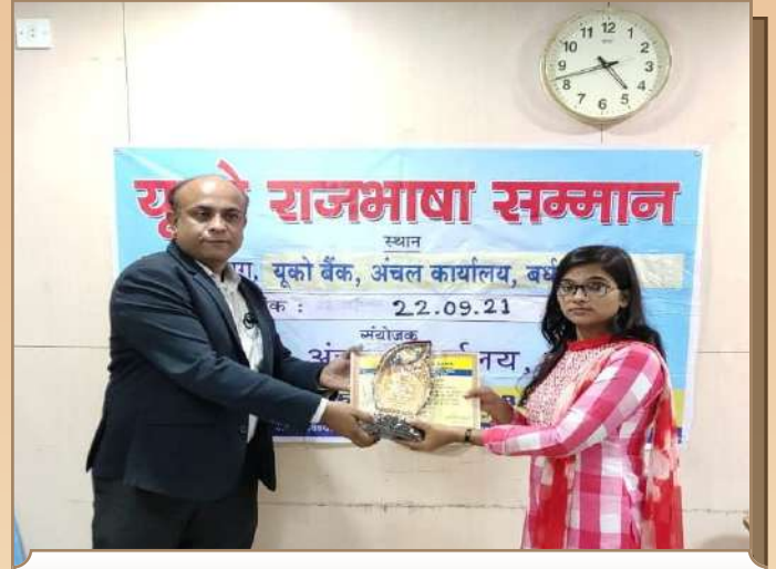
अंचल कार्यालय वर्धमान