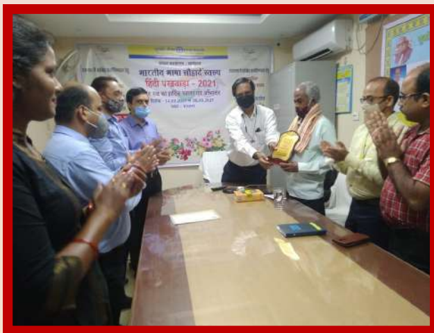
अंचल कार्यालय बालेश्वर