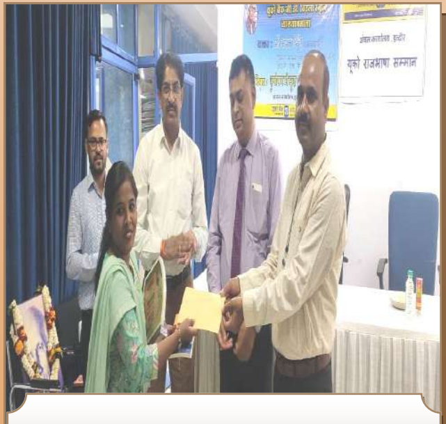
अंचल कार्यालय इंदौर