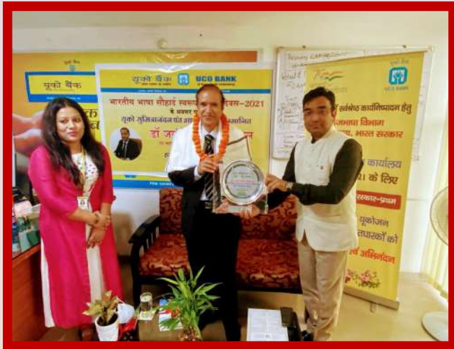
अंचल कार्यालय देहरादून