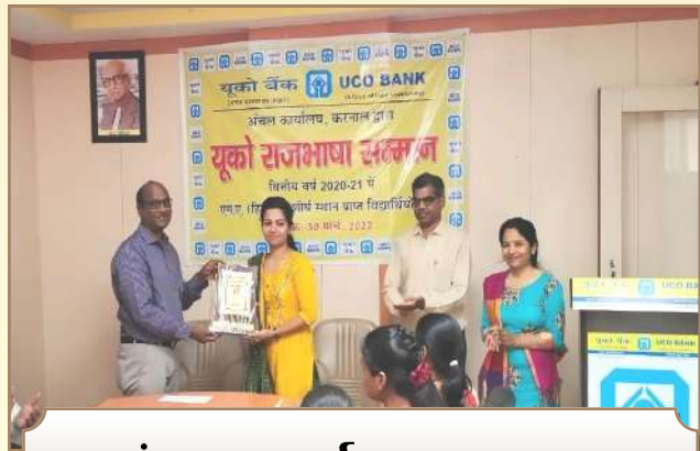
अंचल कार्यालय करनाल