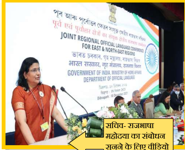
सचिव- राजभाषा महोदया का संबोधन सुनने के लिए वीडियो विडह पर विलक करें।