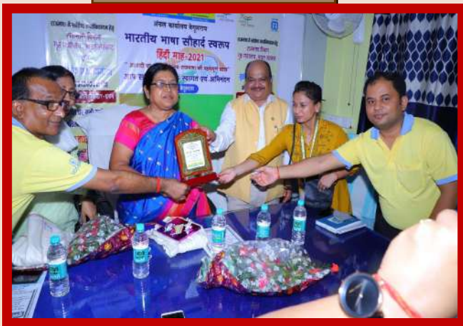
अंचल कार्यालय बेगूसराय