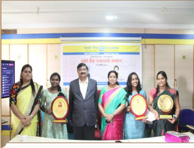
अंचल कार्यालय एर्णाकुलम