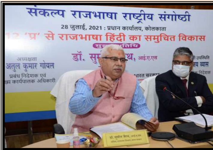
माननीय सचिव महोदय का संबोधन

बैंक की 'हिंदी भाषा-साहित्य मेधावी विद्यार्थी प्रोत्साहन योजना' के अंतर्गत वर्ष 2019-20 तथा 2020-21 में रबीन्द्र भारती विश्वविद्यालय, कोलकाता के स्नातकोत्तर हिंदी में शीर्ष प्रथम एवं द्वितीय स्थान प्राप्त करने वाले विद्यार्थियों को 'यूको राजभाषा सम्मान' जिसके तहत स्मृतिका, प्रमाणपत्र तथा रु. 5000/- का चेक माननीय एमडी एवं सीईओ द्वारा प्रदान किया गया।