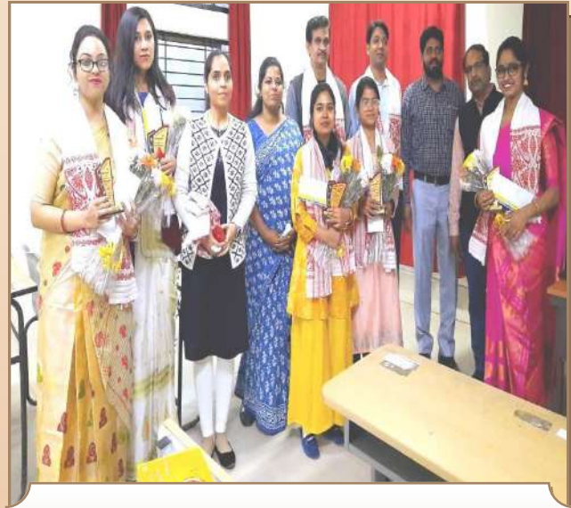
अंचल कार्यालय जोरहाट