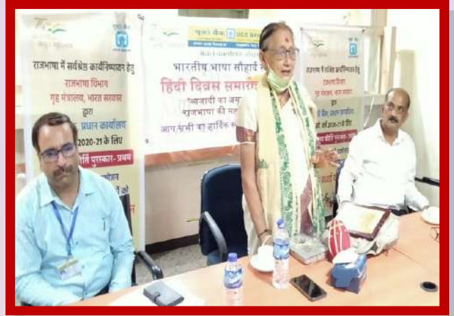
अंचल कार्यालय जोरहाट