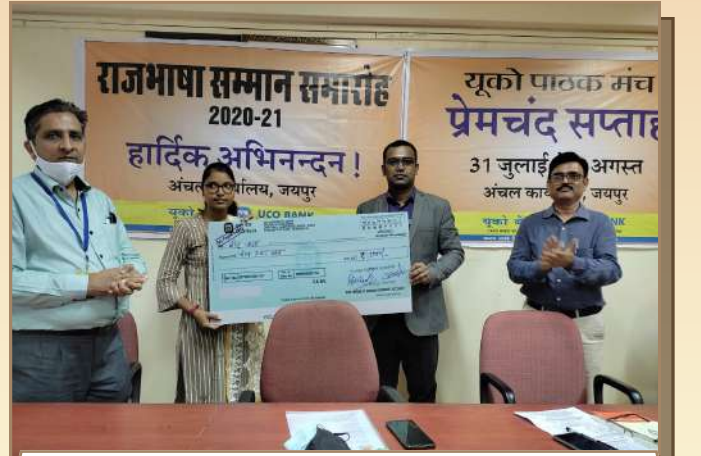
अंचल कार्यालय जयपुर