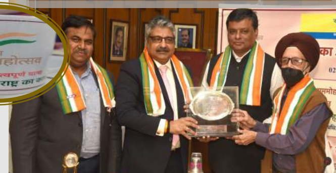
यूको बैंक द्वारा दिनांक 02.12.2021 को आयोजित आजादी का अमृत महोत्सव: देशभक्ति काव्य-संध्या में काव्य प्रस्तुति