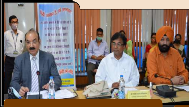
संगोष्ठी के दौरान ईडी सर का संबोधन