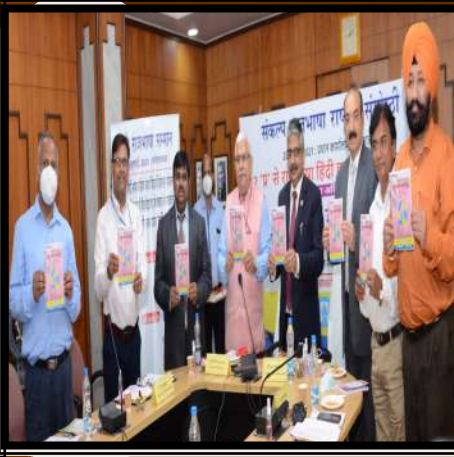
यूको भारतीय भाषा सेतुका: