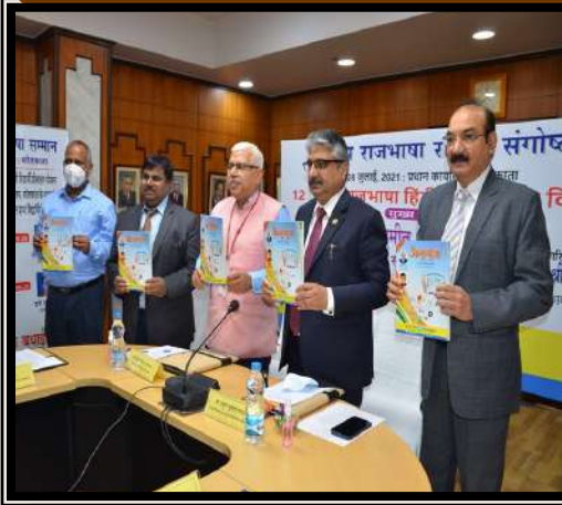
बैंक की गृह पत्रिका 'अनुगूँज' के नवीनतम