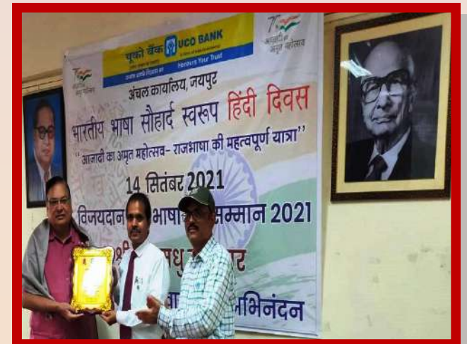
अंचल कार्यालय जयपुर