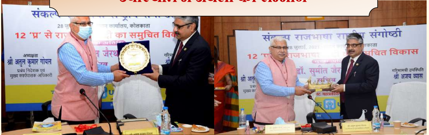
एमडी सर माननीय सचिव महोदय को स्मृतिका एवं उपहार भेंट करते हुए