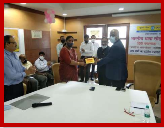
अंचल कार्यालय मुंबई