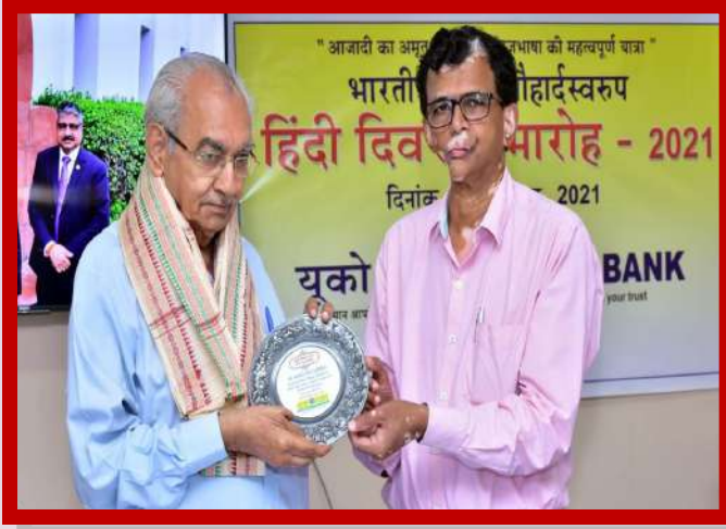
अंचल कार्यालय भुवनेश्वर