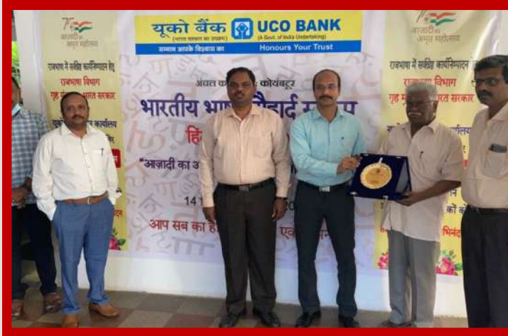
अंचल कार्यालय कोयंबटूर