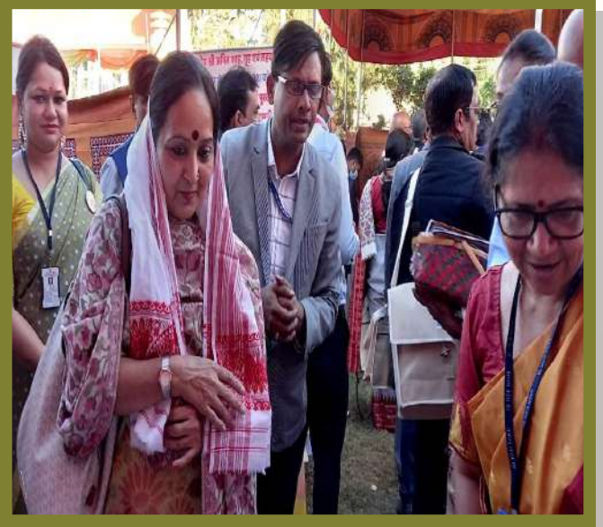
डॉ मीनाक्षी जौली, संयुक्त सचिव, राजभाषा विभाग, भारत सरकार का यूको बैंक के स्टाल पर स्वागत