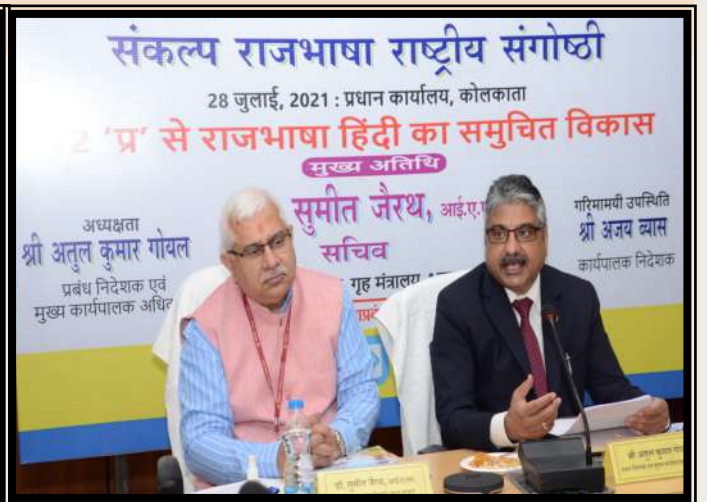
एमडी सर का संबोधन