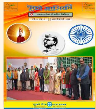
जनवरी- फरवरी 2022