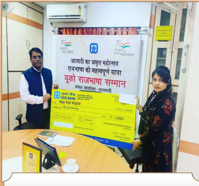
अंचल कार्यालय वाराणसी