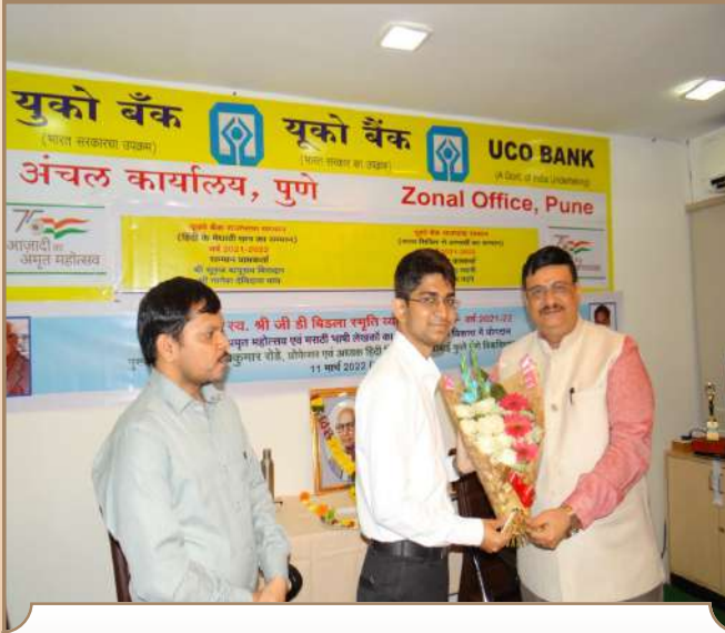
अंचल कार्यालय पुणे