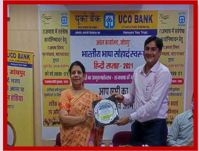
अंचल कार्यालय जोधपुर