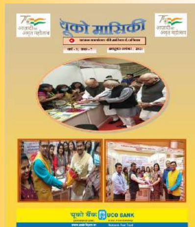
अक्टूबर- नवंबर 2022