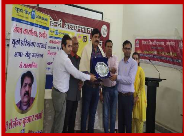
अंचल कार्यालय इंदौर