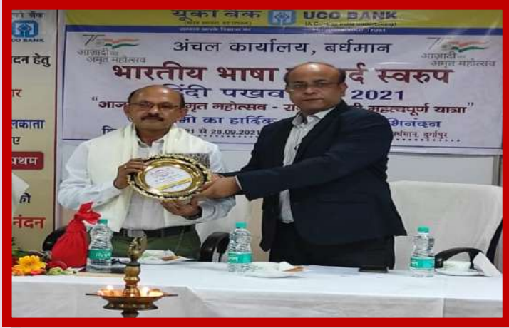
अंचल कार्यालय बर्धमान