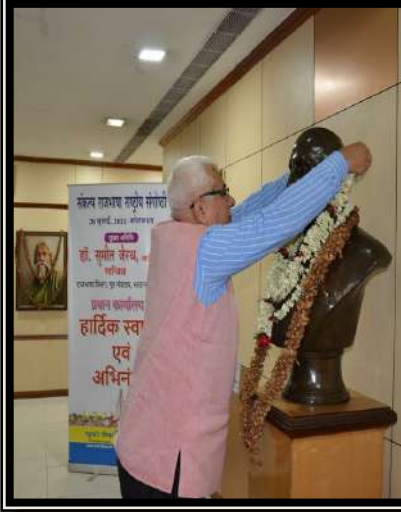
माननीय सचिव महोदय द्वारा स्व.जी डी बिड़ला जी की प्रतिमा पर