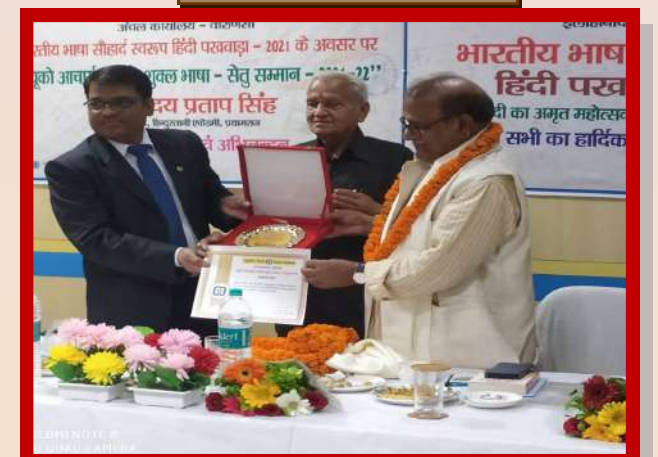
अंचल कार्यालय वाराणसी