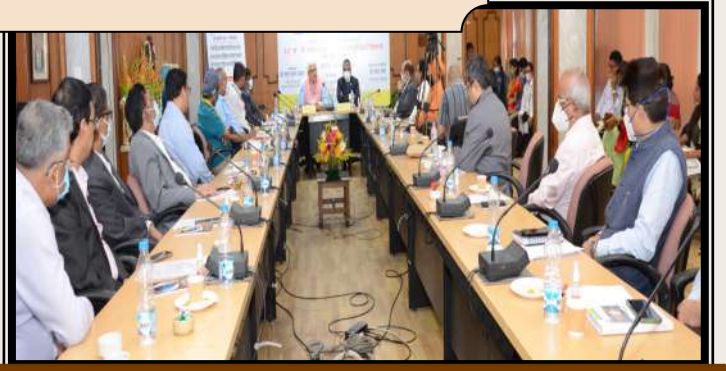
कार्यक्रम के दौरान उपस्थित सभी महाप्रबंधक एवं अन्य अधिकारी